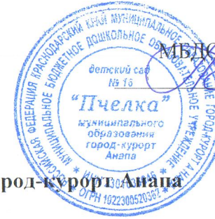
График заседания ППк МБДОУ детский сад №16 «Пчёлка» муниципального образования город-курорт Анапа на 2022-2023 учебный год