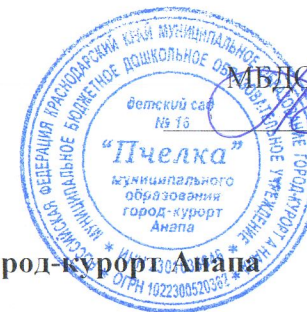
График заседания ППк МБДОУ детский сад №16 «Пчёлка» муниципального образования город-курорт Анапа на 2022-2023 учебный год